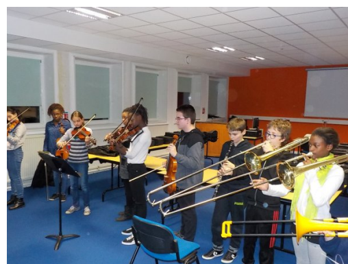
Élèves de 5 ème CHAM lors de la cérémonie de remise des instruments (photo collège)

La mise à disposition des instruments est financée par une subvention de la politique de la ville quartier prioritaire. Les élèves conservent leur instrument jusqu'à la fin de la 3 ème avec possibilité d'achat en fin de collège.