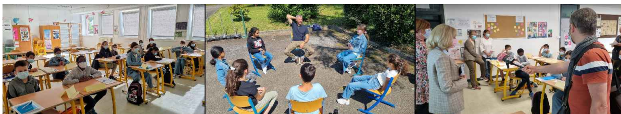
photos collège Max Jacob