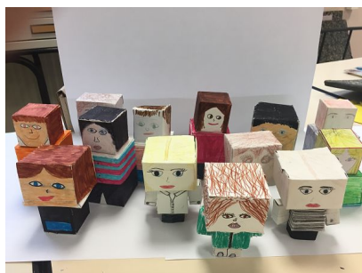
Papertoy des élèves de 5 ème 4 et 5 ème 5.

Article sur le site du collège : http://www.college-max-jacob-quimper.ac-rennes.fr/